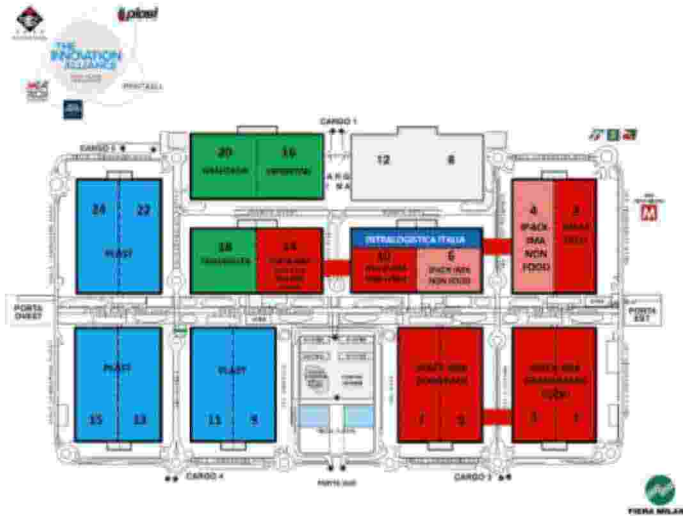
I cinque marchi: Ipack-Ima, Meat-Tech, Plast, Print4All e Intralogistica Italia.

Insomma, The Innovation Alliance deve diventare una «piattaforma d'informazione globale», che serva anche a dare delle risposte tecniche (e non) a problematiche di settore, che non devono essere visti come stand-alone ma a 360° questa è la sfida: perché diventi realtà ci sono 2 anni e mezzo di tempo!